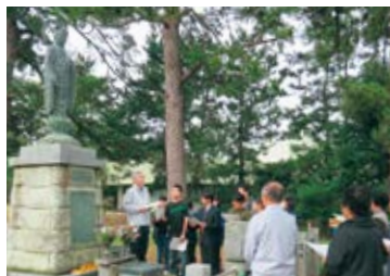
島尾海岸の地蔵尊