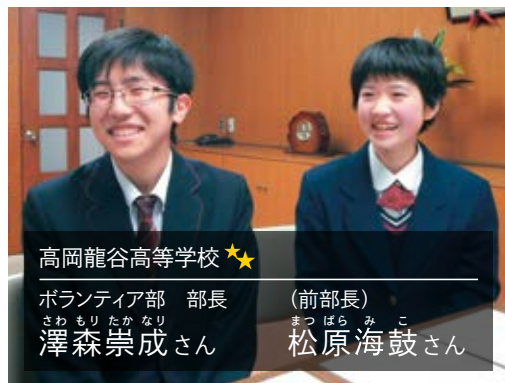
高岡龍谷高等学校★