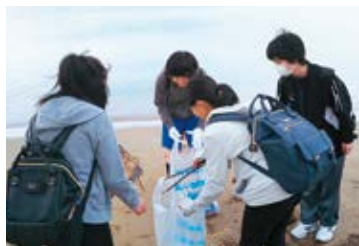
島尾海岸の清掃活動

私たちの学校は浄土真宗本願寺派の宗門校(龍谷総合学園)です。毎年夏休みに寺院で開催される子ども会にボランティアとして参加しています。受付や昼食のお手伝い、腕輪念珠づくりをしました。普段は念珠を使う機会が少ない子どもたちと一緒に楽しめたことは一つの思い出となっています。