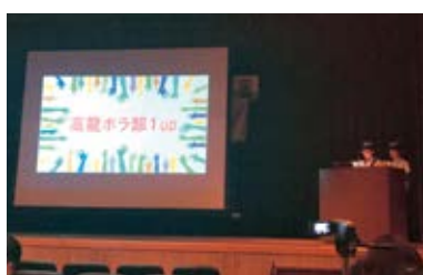
全国高等学校総合文化祭にて