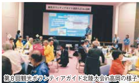
第8回観光ボランティアガイド北陸大会in高岡の様子

高岡市には、観光ガイドボランティアが6グループあります。各グループで、案内地域を分けそれぞれ独自の活動をしています。ガイド依頼が増え、1グループでは対応できない時に他のグループからの応援・連絡を取り合うために昨年2月に協議会を設立しました。昨年の9月27日・28日の両日には、「第8回観光ボランティアガイド北陸大会in高岡」を高岡商工会議所で開催し、北陸三県のボランティアガイド350人が結集しました。まだ、発足したばかりの協議会ですが、これからも結束を固めて活動したいと思っています。