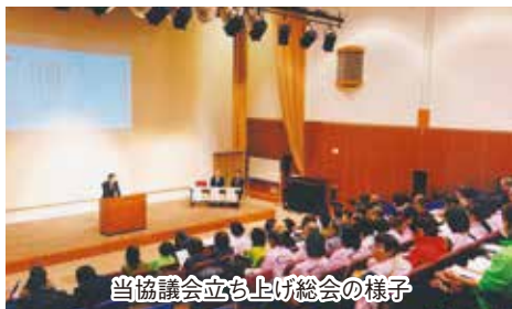
当協議会立ち上げ総会の様子