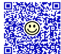
産後ケア教室申込みフォーム